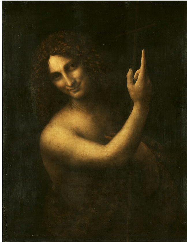
Leonardo da Vinci, San Juan Bautista , 1513-1516.